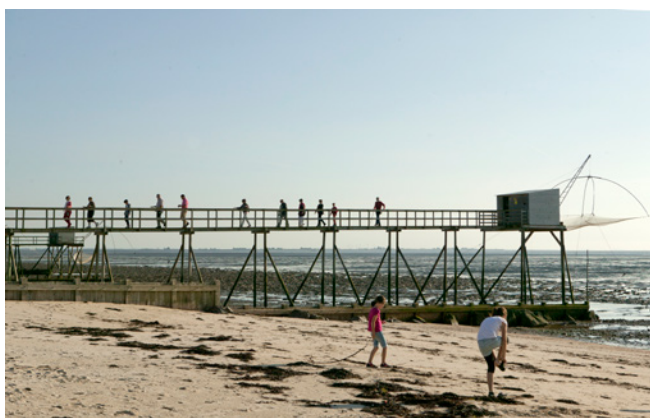
Les Moutiers