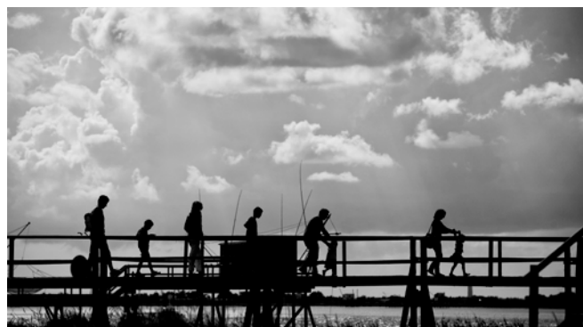
Visite de pêcheries en famille